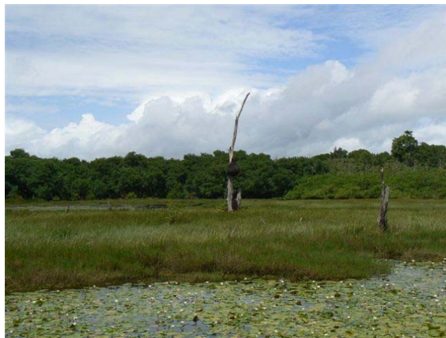
Vue de la lagune depuis l'observatoire des salines de Montjoly.

Il s'agit de 2 sorties d'une demi-journée chacune, qui se dérouleront aux Salines de Montjoly en partenariat avec le Conservatoire du Littoral. Ces balades grand public de 2h30 s'effectuent sur un sentier facile en milieu ouvert, où l'avifaune n'est pas très dure à observer. Et puis c'est l'occasion pour l'association de voir son travail de sensibilisation rémunéré.