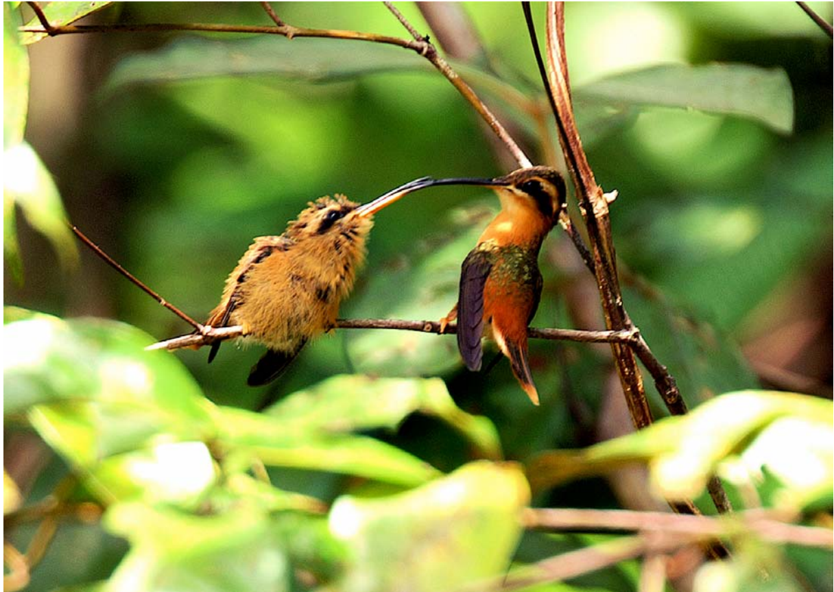
Scène de nourrissage chez l'Ermite roussâtre, piste Solitaire, route du Galion, août 2007.

Nouvelle rubrique dans le Kiskidi , l'instantané d'un moment de nature, signé ce mois ci par Michel GIRAUD-AUDINE, grand contributeur bénévole à la base de donnée photographique du GEPOG.