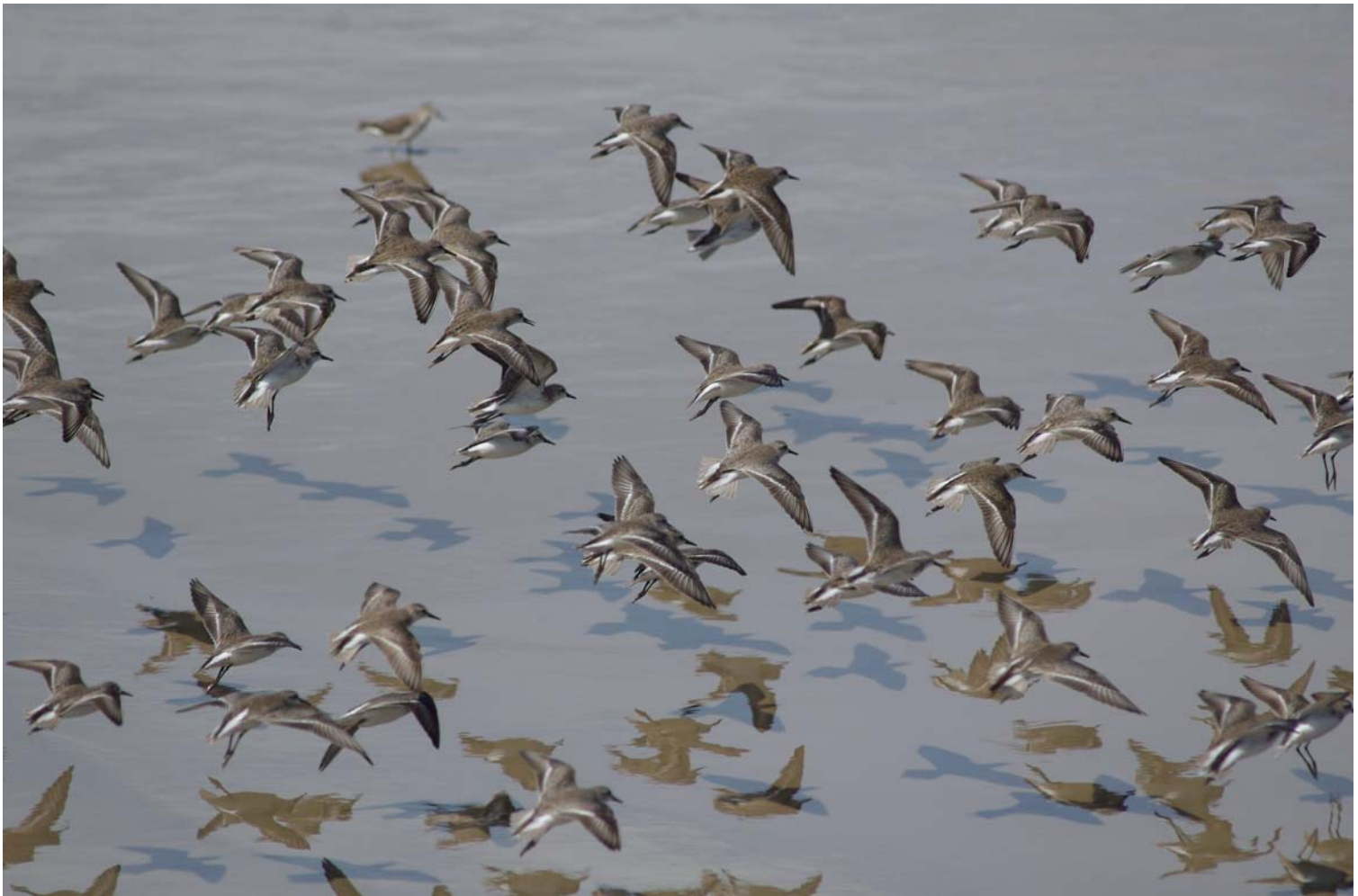
Jeux d'ombres et de reflets d'un groupe de Bécasseaux semipalmés (Calidris pusilla), s'apprêtant à atterrir sur la vasière du vieux port à marée descendante, Cayenne, fin décembre 2007.

Ce mois ci, c'est Tanguy DEVILLE qui signe la photo du mois. Elle a été prise sur la digue du vieux port de Cayenne, notre nouveau rendez-vous mensuel du point fixe.