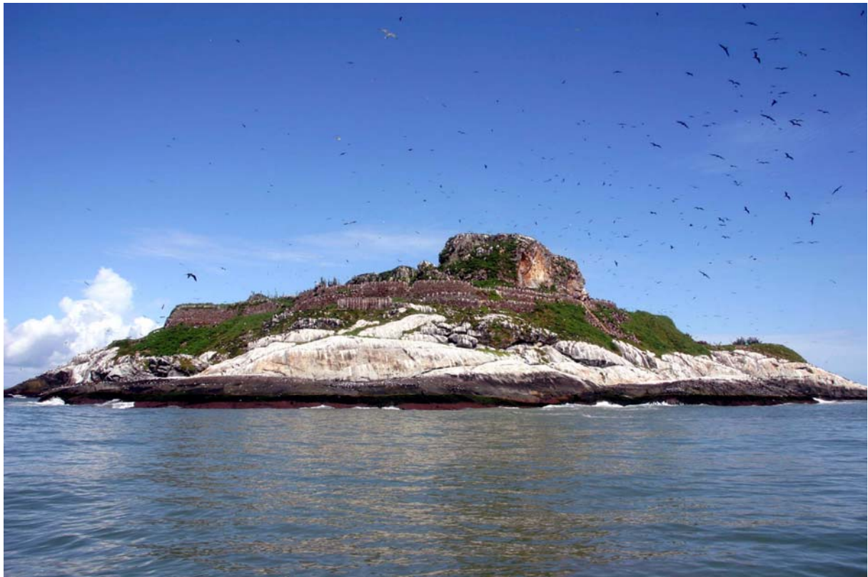
L'Île du Grand Connétable et le ballet incessant des Frégates superbes en période de nidification

Depuis le 01 janvier 2008, le GEPOG et l' Office National de la Chasse et de la Faune Sauvage (ONCFS) sont désormais co-gestionnaires de la Réserve Naturelle de l'Île du grand Connétable !