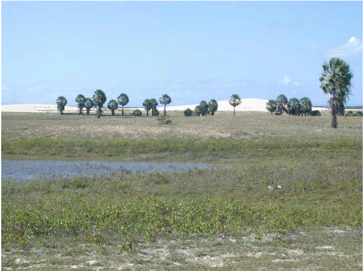
Llagunes et dunes de Macapà, dans le Piauí.