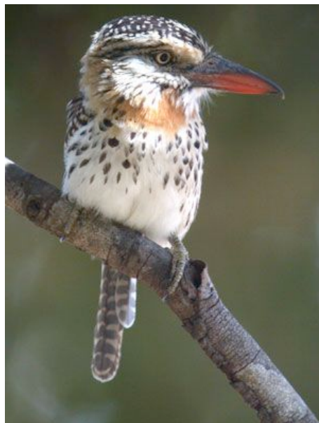
Tamatia tamajac (Nystalus maculatus)

Enfin, nous avons observé 1 seul individu de Conopophaga roberti (Conopophage capucin), dans d'excellentes conditions, dans le P.N. d'Ubjara.