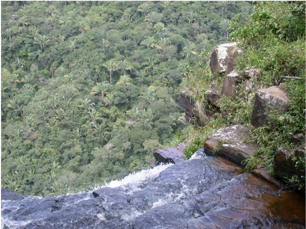
Parc Natuional de Ubajara (Ceara)