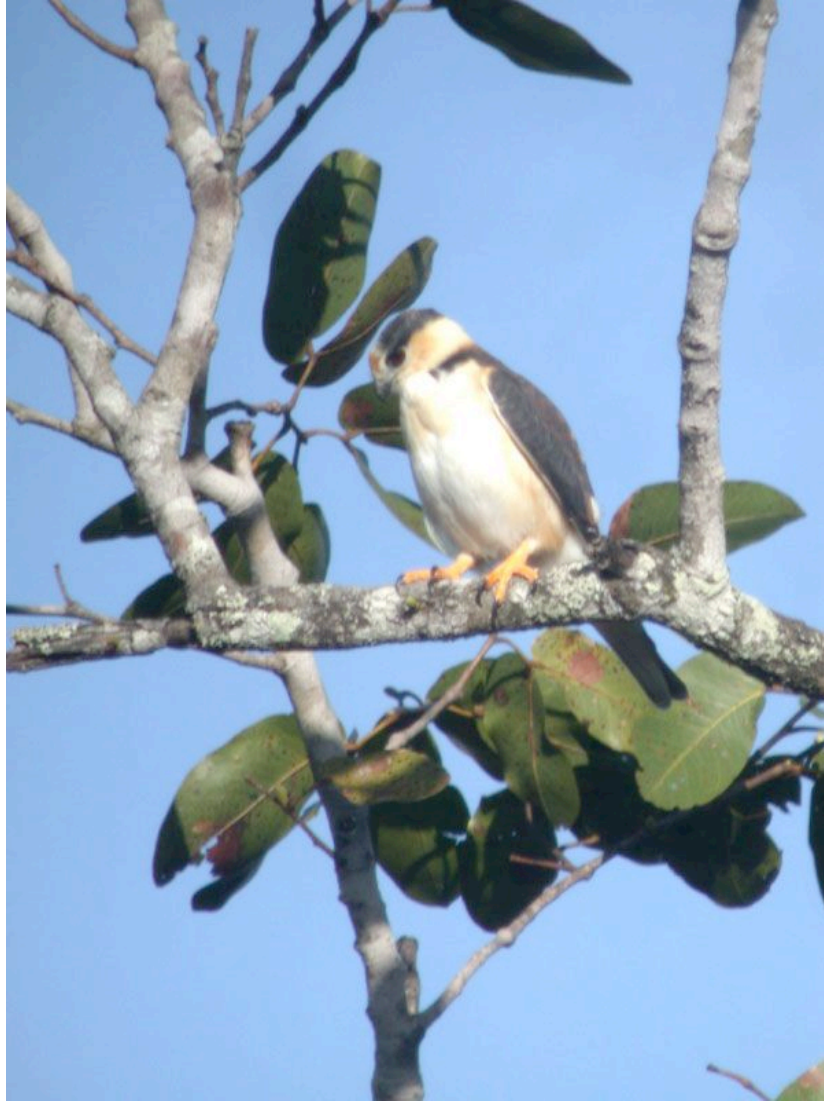
Elanion perle (Gampsonyx swainsoni)